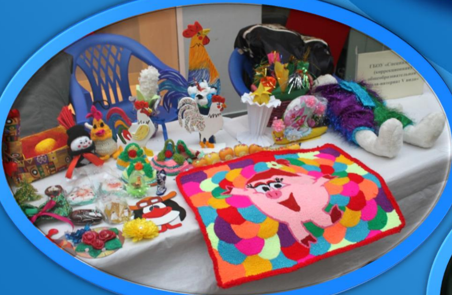
Участие школы в акции «Благотворительный марафон»