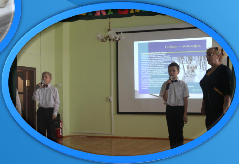
Защита презентаций об инвалидах Республики Бурятия, известных в спорте, искусстве